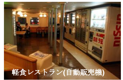
軽食レストラン(自動販売機)