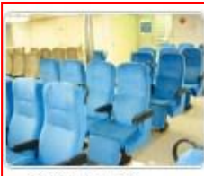
⑥ 2等椅子席 (リクライニングシート)